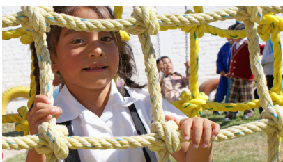
Reporte anual 2011

Resultados del proyecto: Los beneficiarios directos incluyen 942 niñas/os, 48 docentes y autoridades educativas y 200 madres y padres, quienes influenciaron indirectamente a 4,760 personas más. Hubo un aumento de 27%